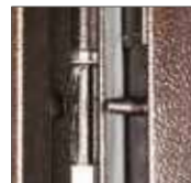
ПРОТИВОСЪЕМНЫЕ РИГЕЛИ, ПЕТЛЯ