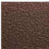
ЦВЕТ: АНТИК МЕДНЫЙ