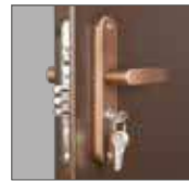
ЦИЛИНДРОВЫЙ ЗАМОК ПРОСАМ